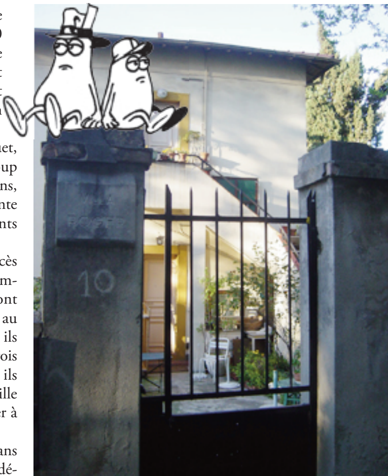
La maison où Roger a vécu son enfance, au 10 chemin du Fort Tahon, à Nice.

C'est certainement au cours des premières nuits dans leur toute nouvelle demeure, excités par leur récente indépendance, que les époux Roger conçurent leur rejeton.