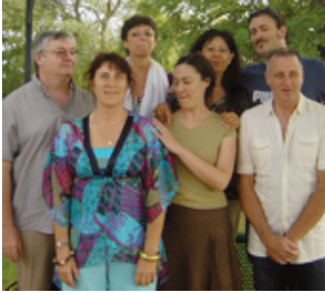
Avec l'équipe du Sésame 2009